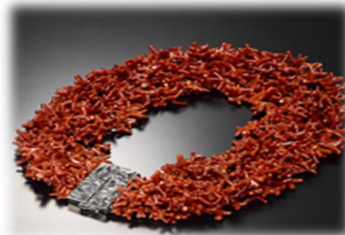
Coralli e Cammei