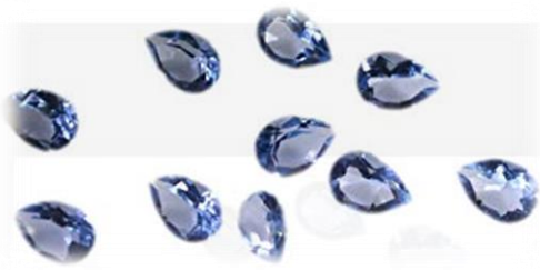
Pietre preziose e semi preziose